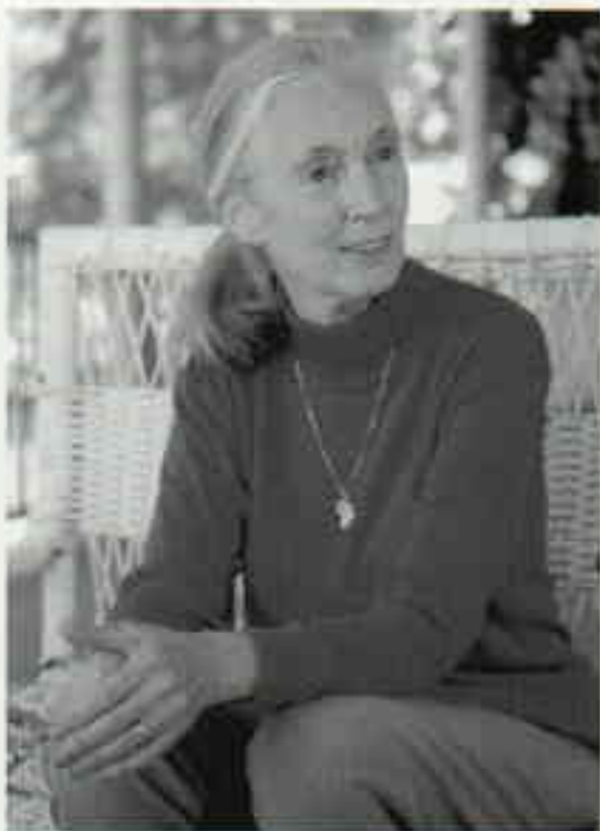
ジェーン・グドール Jane Goodall